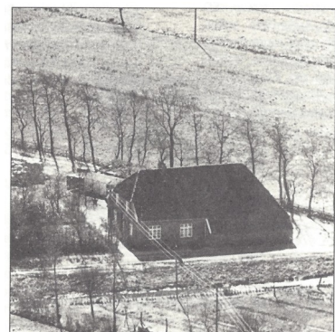
Wohnhaus der Familie de Wall in Mittegrosßefehn. ca. 1950

1867 wird eine neue Nummerierung in Mittegrosßefehn eingeführt. Das Haus Nr. 104 wird Nr. 74